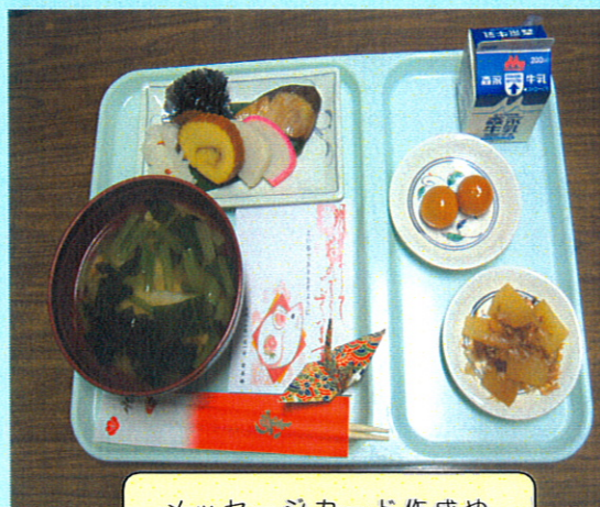
メッセージカード作成や 折り紙等の内職もします

苦情もあり、気持ちが滅入りそうなこともあります。患者様からの「おいしかったよ」が何よりもうれしく、元気が貰えるような気がします。