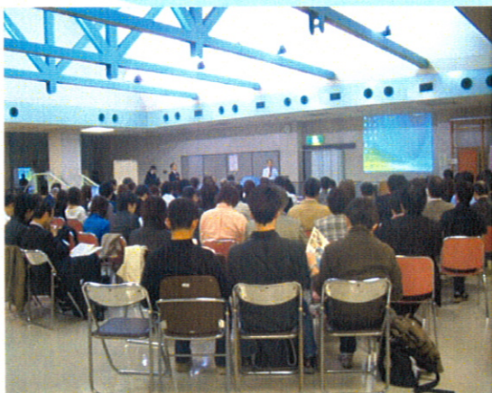
講演会場(上) 懇親会場(下)